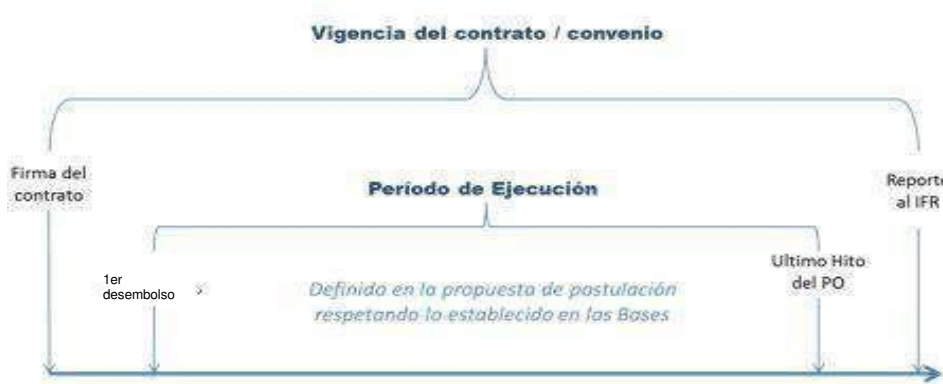
Figura 1. Vigencia y Periodo de Ejecución