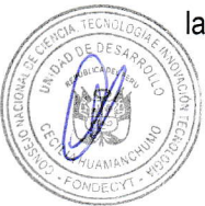
Dr. Salomón Soldevilla Canales Director Ejecutivo (e) FONDO NACIONAL DE DESARROLLO CIENTÍFICO, TECNOLÓGICO Y DE INNOVACIÓN TECNOLÓGICA