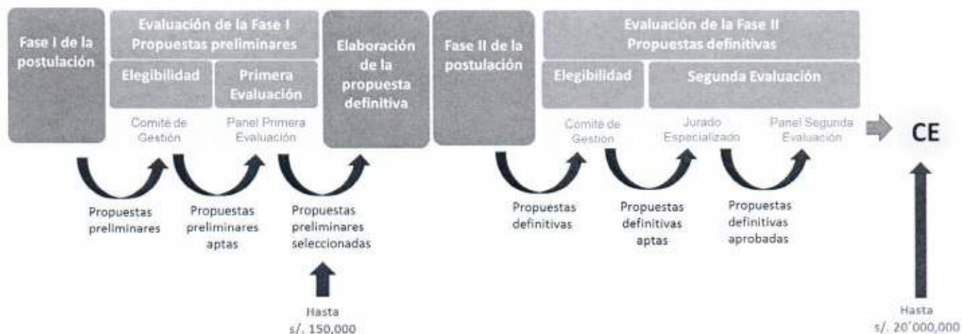
Figura 2: Proceso evaluación

La Dirección Ejecutiva del FONDECYT elevará al Consejo Directivo del FONDECYT los resultados del concurso para su ratificación y aprobación.